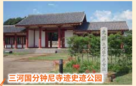
三河国分钟尼寺迹史迹公园

●天平13年(公元741年),根据圣武天皇下达的「国分钟寺建立诏令」在各国作为大本山建设东大寺。于8世纪后半完成。