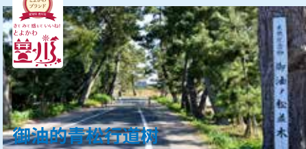
御油的青松行道树