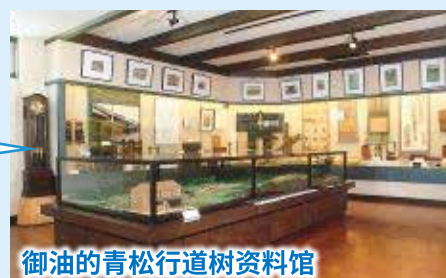
御油的青松行道树资料馆