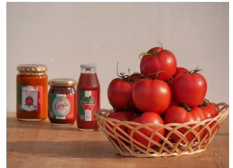
チキンカレーの他にもトマトジュースやトマトソースなど、様々な商品を開発