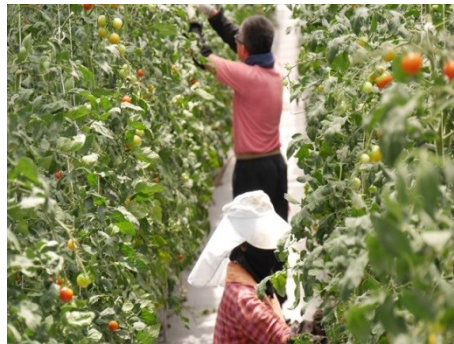
植物の成長にとって最適な環境を整え、愛情を持って育てています