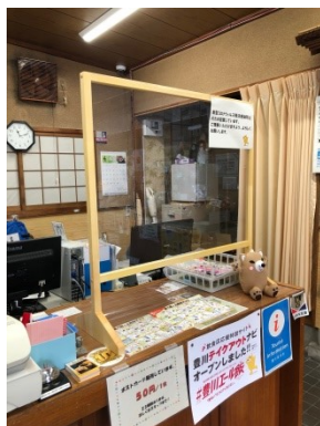
希望があれば、特注製作によるサイズオーダーも可能です。