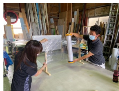
1つ1つ、手作りで丁寧に製作しています。