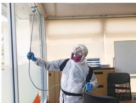
専門のスタッフによる丁寧な施工を行います。

使用する除菌剤は、厚生労働省が推奨している「次亜塩素酸ナトリウム」をベースに、抗菌・抗ウイルス剤を独自に配合させた人体に無害な消毒液となっている。併せて行うコーティングも、第三者機関(SIAA)で抗菌・抗ウイルス性能の認可を受けた。本サービスは、コロナウイルスに負けずに頑張っている地元企業に対して、何かサポート出来ないかと模索する中で生まれた。