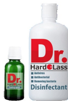
除菌・コーティング剤は日本で開発された「Dr.ハドラス」を使用。