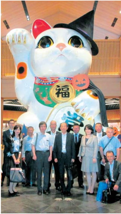
イオンモール常滑を視察

②利用料金は無料。ただし、 体駐車場のご利用を。会議所会館の利用申込みについては、利用日の6カ月前から受け付け開始。※問合せ (TEL) (86) 4101、佐々木 会議所会館内は無線LANが無料で利用できます 当所会館内では、パソコンやスマートフォン、タブレットなどから無線LAN環境でインターネット接続が利用可能。利用に関する注意事項は次のとおり。 ①利用可能エリアは、商工会議所会館内及び各フロア(一部テナント部分は除く)。ただし接続機器によっては繋がりにくい場所もある。 ②無線LANは、無線LANカードなどの機器の貸し出しは行わない。 ③接続には必要なパソコン、無線LANカードなどの機器の貸し出しは行わない。 ④利用する際は「不正アクセス行為の禁止等に関する法律」を遵守することとする。 ⑤セキュリティ対策は利用者で行うこと。 ⑥接続された機器のウイルス感染、情報漏えいなどによる被害に対しては、豊川商工会議所は一切の責任を負わない。 ⑦利用者の予告なく接続を中止、廃止することがある。