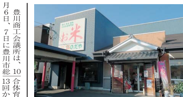
元気なお店大賞部門 会頭賞 米の専門店のだや

者の経営分析・経営計画の発行支援、展示会開催等の需要開拓を促進し、事業者の技術の向上、新事業分野開拓など、経営の「第13回かわしんビジネス交流会」への共同出展を支援した。