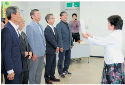
参加チームを代表して宣誓

豊川商工会議所と音を開催した。 進発式には、市内の会 町商工会は、豊川市管内 員事業所に勤務している ラリー参加者が一堂に会 している事を受け、交通 事故を未然に防ぎ、交