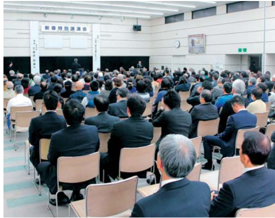
2階ホール 定員/225名357㎡ 使用例/研修会・講演会・説明会など

会議・研修会に 会議所会館のご利用を 豊川商工会議所は、各会が行える225名収容のホールをはじめ、各種講習・講演会やセミナーのホールをはじめ、会議・研修会・説明会等用として、パティール、展示場、研修会・説明会等用