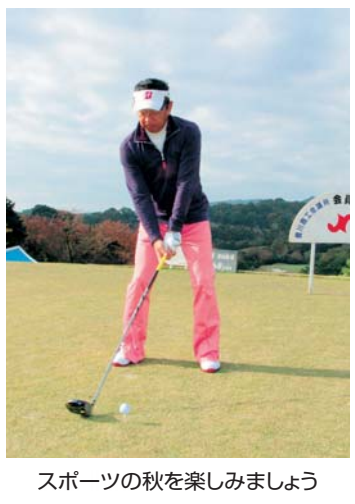
スポーツの秋を楽しみましょう

▽とき 11月17日(金) 1組目午前9時スタート ▽ところ 東海カントリークラブ ▽参加資格 本所会員事業所の代表者、従業員。団体戦は3人または4人で1組(団体の上位3名の合計で競う)。競技方法等の詳細は組合せ表と後日郵送。組合せ、スタート順は事務局で決定。 ▽定員 120名 ▽会費 5500円(賞品、パーティ代を含む) ▽ビジュターのプレー代は、セルフ1万9100円。キャディー付(先着30組まで)1万4000円。但し、事前予約 ※料金にはゴルフ場利用税・振興基金・消費税を含む。 ▽競技方法 18ホールス