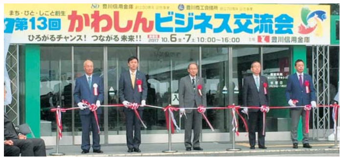
豊川商工会議所は、10月6日、7日に豊川市総合体育館で行われた「第13回かわしんビジネス交流会」に出席した(II写真右)。

豊川商工会議所は、型小規模事業者支援推進事業「経営発達支援計画」に基づき「平成29年度伴走型5社の交流会出展を支援」を支援した。出展を支援した小規模事業者は以下のとおり。 【体育館内】 高次元研究所、末広ライフパ、イトナズ(株)、マルヤマ(有)体育館外、(有)千石寿し、(有)日豊製作所(やねのっぽ)。 来場者でにぎわう共同出展ブース