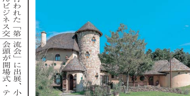
まちなみ景観大賞部門 市長賞 みつばち村(有)さんぼ道

「元気なお店大賞」会頭賞 米の専門店のだや 「まちなみ景観大賞」市長賞 みつばち村(有)さんぼ道 豊川商工会議所と豊川市商店街連盟は、魅力ある店舗や、新築で地域のまちづくり、美観づくりに寄与している建物に対し表彰を行う「元気なお店大賞」と「まちなみ景観大賞」の審査会を9月6日と8日に開催。次のとおり各賞を決定した。 表彰式は11月25日、豊川商工会議所で行う。 賞 一 豊川商工会議所会頭(61・10) 米の専門店のだや 二 豊川市商店街連盟会長(米穀店・八幡町西赤土賞) カフェギヤラリー栄