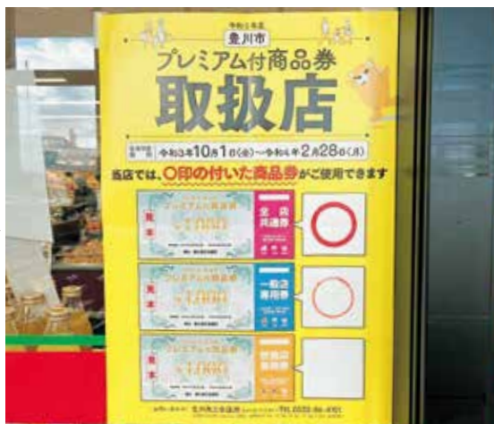
取扱店ポスターの貼られたお店で使えます

豊川商工会議所が発行する地域商品券で、金券として利用できる。一セットあたり1万3000円分(1枚10000円の13枚綴りで、一般店のみ使える「一般店専用券」8枚と、飲食店のみ使える「飲食店専用券」2枚と、大型店でも使える「全店共通券」3枚)を1万円で購入した。利用可能期間は令和3年10月1日(金)〜令和4年2月28日(月)まで。取扱店舗にはポスターが掲示されている。