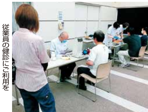
従業員の健康診断にご利用を

印をご用意の上、マスク着用でのご来所を。 ▽とき 2月8日(月)～4月15日(木)の期間(土日祝除く)で、受付時間10時～12時、13時～16時 ▽ところ 豊川商工会議所 ▽相談料 無料