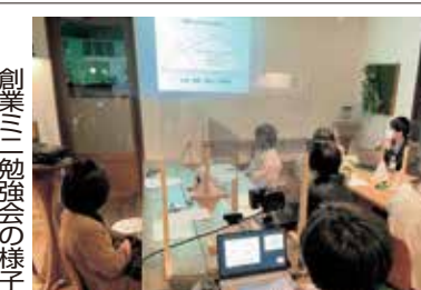
創業ミニ勉強会の様子

要(各日先着順に受付)。必要書類をご持参の上、付申付、住宅借入金等控除、年金申告、株式、土地等の譲渡申告の方は受付けない。 ▽お申込み 事前連絡不要 ※問合せ 豊川商工会議所経営支援グループ (TEL) 86-4101