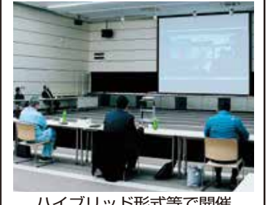
ハイブリッド形式等で開催

令和3年度事業計画(案)を策定し、1月13日(水)～2月9日(火)までの間で各部会・委員会を開き、令和3年度の事業計画大綱に基づいた部会・委員会の