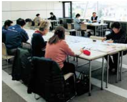
確定申告はお早めに

決算(所得税・消費税)申告相談 期間を4月15日まで延長 豊川商工会議所は、個々まで延長する。特に令和人事業主の決算、および2年分は基礎控除や青色確定申告(所得税・消費税)申告特別控除の変更がある(税)の相談について、不安な方は本相談期間延長に伴い、相談談のご利用を。相談は無受付期間も4月15日(木)料。当日は必要書類、認