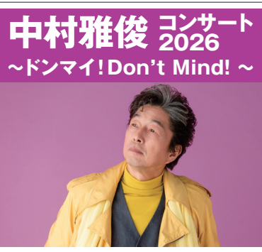
中村雅俊コンサート ～ドンマイ! Don't Mind! ～

▽とき 令和8年3月8 日(日) 17時 ▽ところ 豊川市文化会 館大ホール ▽入場料 全席指定80 00円(未就学児の入場 82)