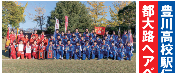
愛知県予選会で優勝した豊川高校駅伝部

「香り華やかで、生酒特融のなめらかな口当たり。米の旨味が感じられ、どんな食事ともあう食中酒」と大変好評で、家庭・飲食店などで「叶」が愛飲されることが期待される。 試飲会の様子