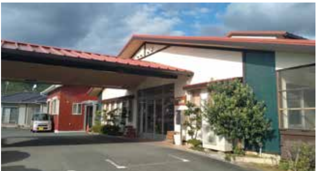
元気なお店大賞 昨年度 会頭賞 喜ら里