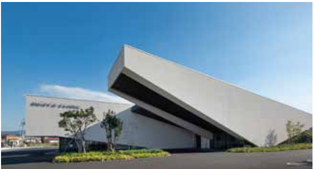
とよかわ まちなみデザイン大賞昨年度金賞 安形医院

応募は、所定の応募用紙を豊川商工会議所ホームページから入手し、9月1日(月)までに事務局長へ。顕彰式は、11月22日(土)の豊川商工会議所会員大会で行う。なお対