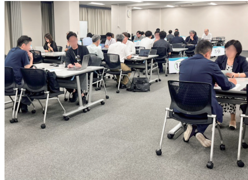
活発な商談が行われた

愛知県の22商工会議所と浜松、岐阜、四日市商工会議所が主催し、規模域から多種多様な企業が集い、商品やパンフレットなどを提示しながら、