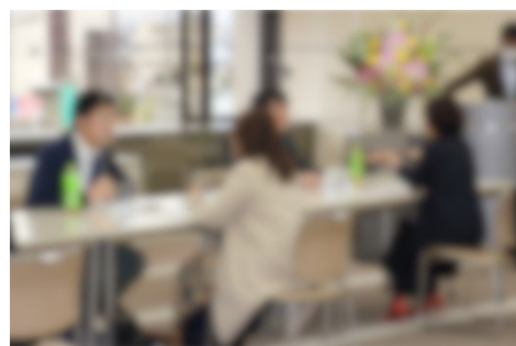
多くの相談実績を基に、様々な観点からサポート ※写真は婚活イベントの様子