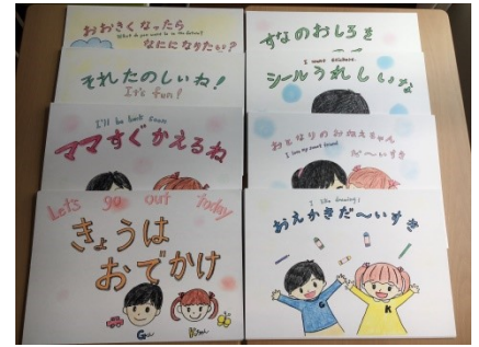
温かみのある手書きの紙芝居の読み聞かせを1回15分ほどで行う