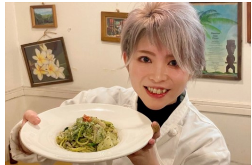
大葉パスタを開発した柿下社長(シェフ)