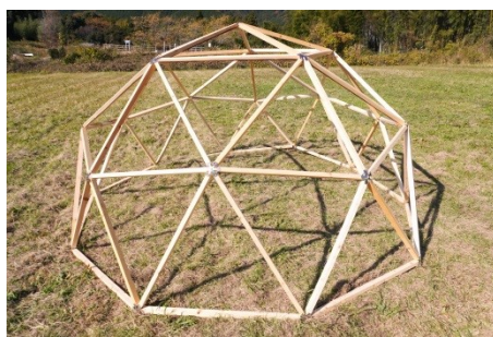
木材等のサイズを変えることで、お好みのサイズに調整することが可能です。