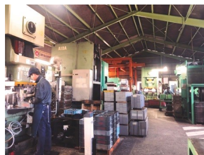
創業以来培ってきた高い技術力により、本製品の開発に成功した。