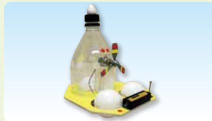
小惑星探査車 (2019年6・7月作品)