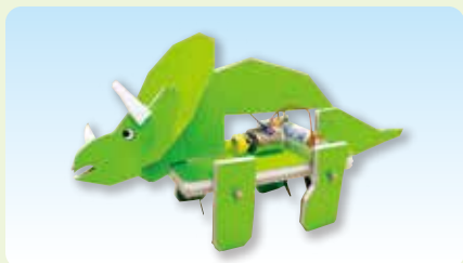
恐竜ロボット (2019年10・11月作品)