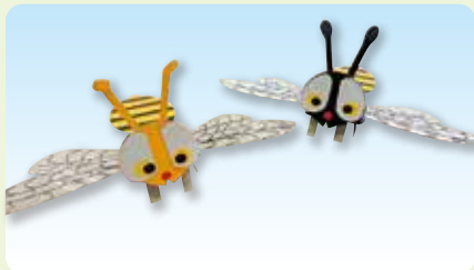
インセクトロボット (ハチ) (2019年4・5月作品)