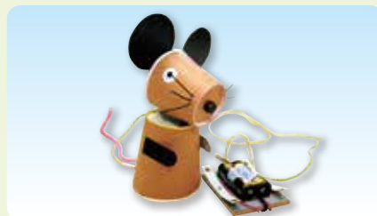
アニマルロボット (ねずみ) (2019年12月・2020年1月作品)