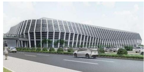
ポートメッセなごや新第1展示館にて 開催予定